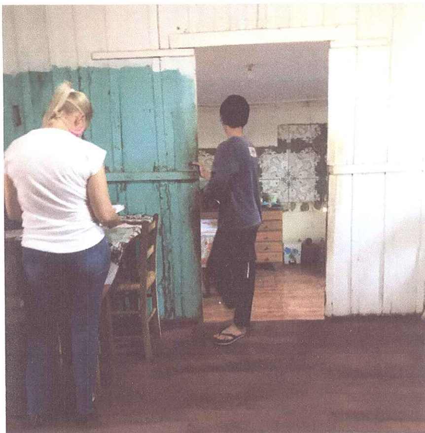
FIGURA 1 - PROFESSORA DO AEE ENTREGANDO ATIVIDADES PARA OS ALUNOS