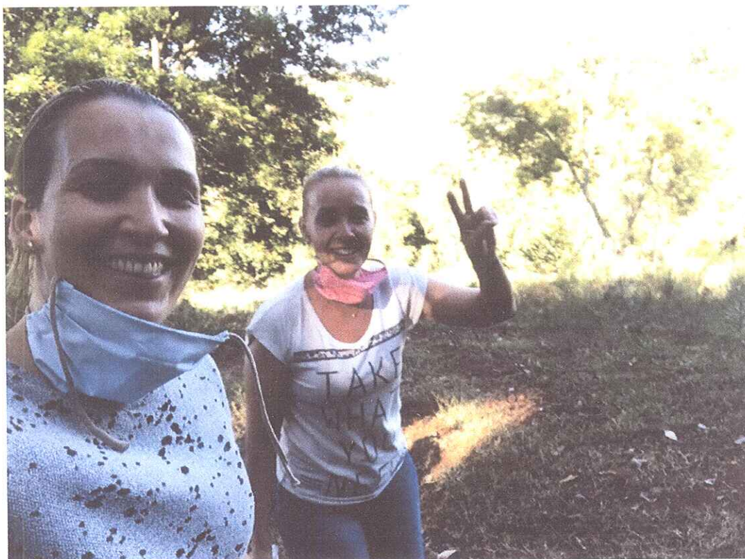
FIGURA 6 - PELO INTERIOR DE ALEGRIA