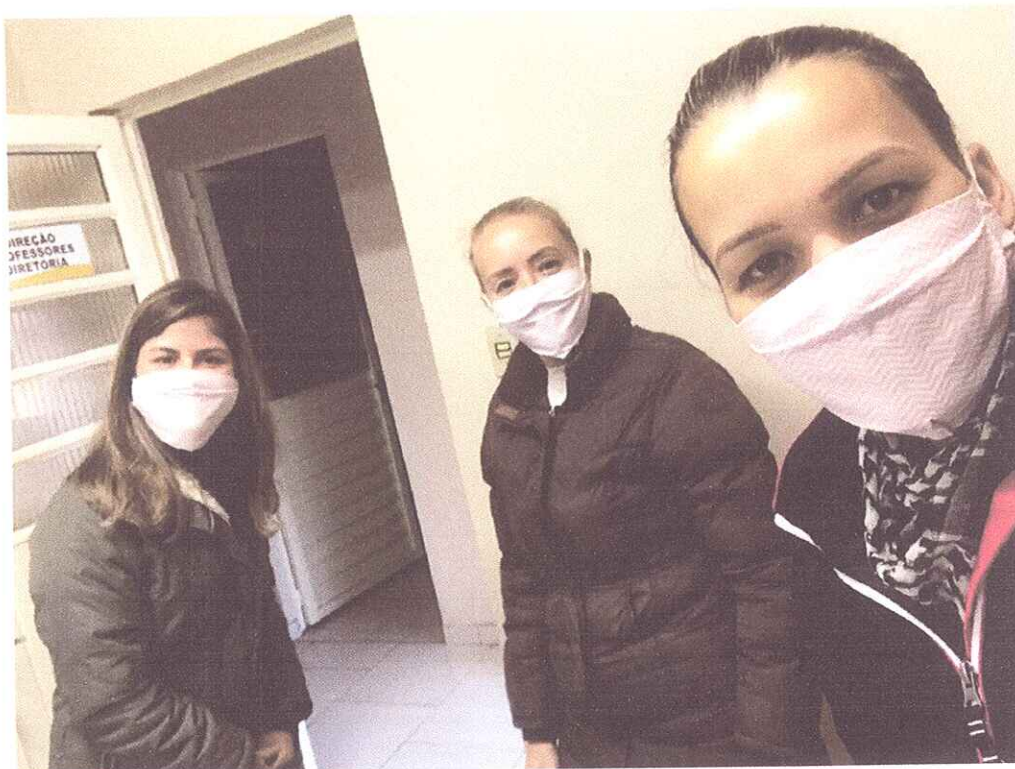
FIGURA 3 - EQUIPE TÉCNICA E PROFESSORA