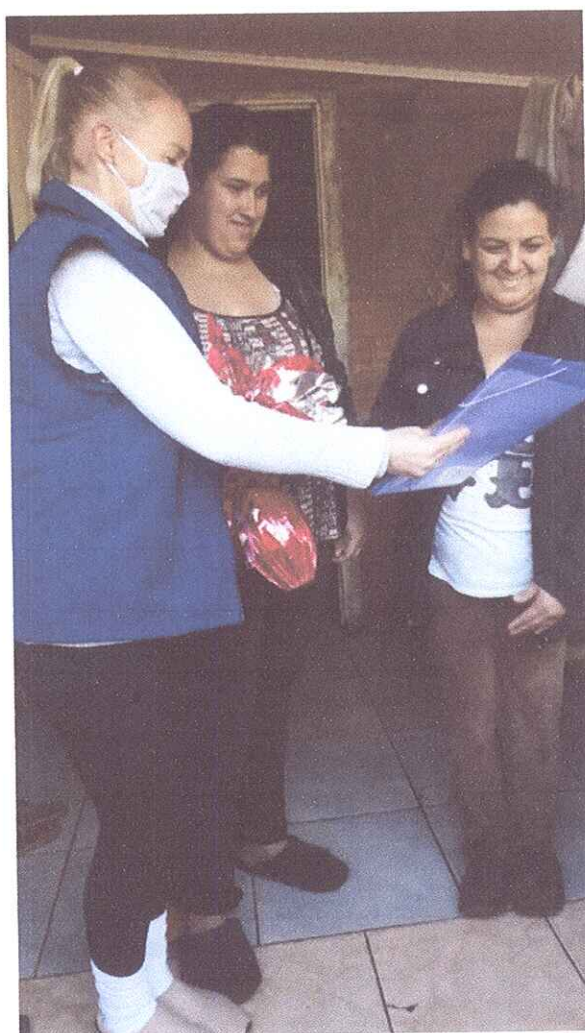
FIGURA 4 - ENTREGA DE ATIVIDADES