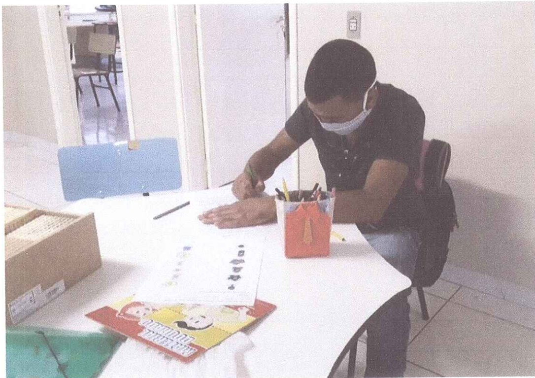
FIGURA 5 - ALUNO FAZENDO ATIVIDADES